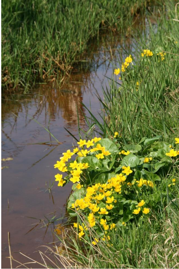
Dotterbloemen langs de Ziegenbeek

gemaakt onze projecten te realiseren en door te gaan met het maken van nieuwe plannen. Met vriendelijke groet,